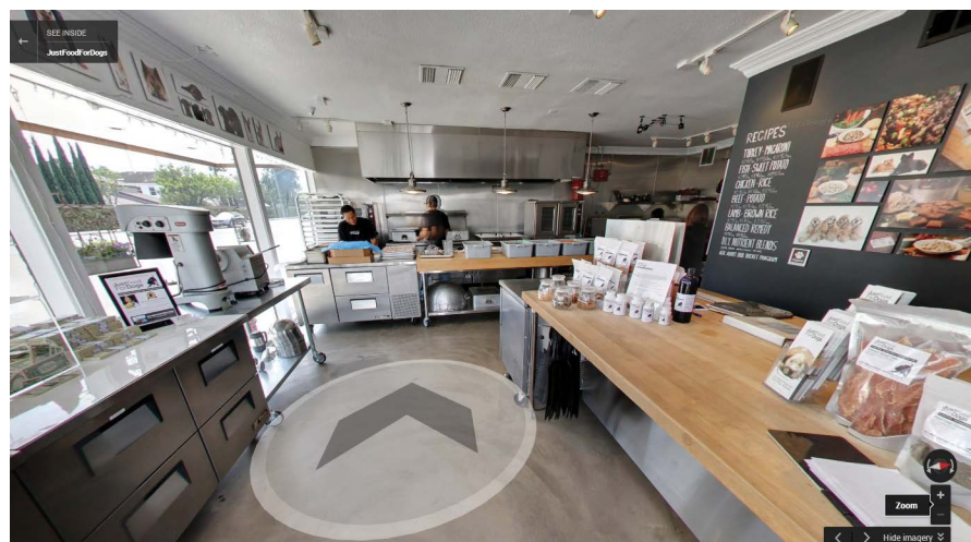
Business View della cucina aperta di "Just Food For Dogs" a Newport Beach, California

- Rudy Poe, socio amministratore Just Food For Dogs